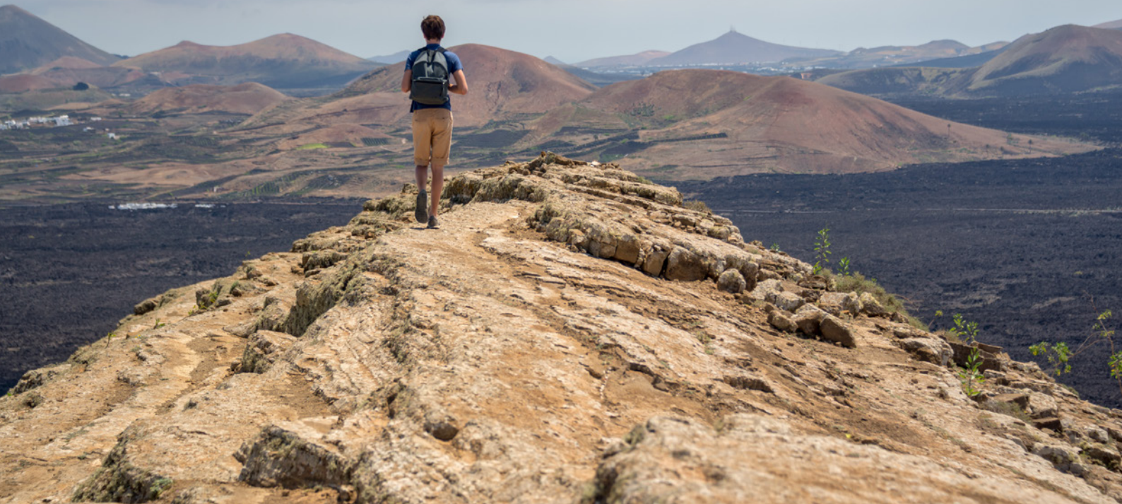
▲ PARQUE NACIONAL DE TIMANFAYA LANZAROTE