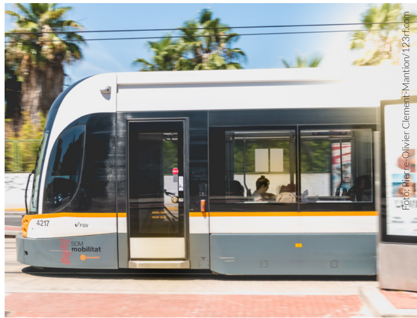
▲ ELÉTRICO VALÈNCIA

❶ Para ampliar a informação, visita www.studyinspain.info e www.spain.info