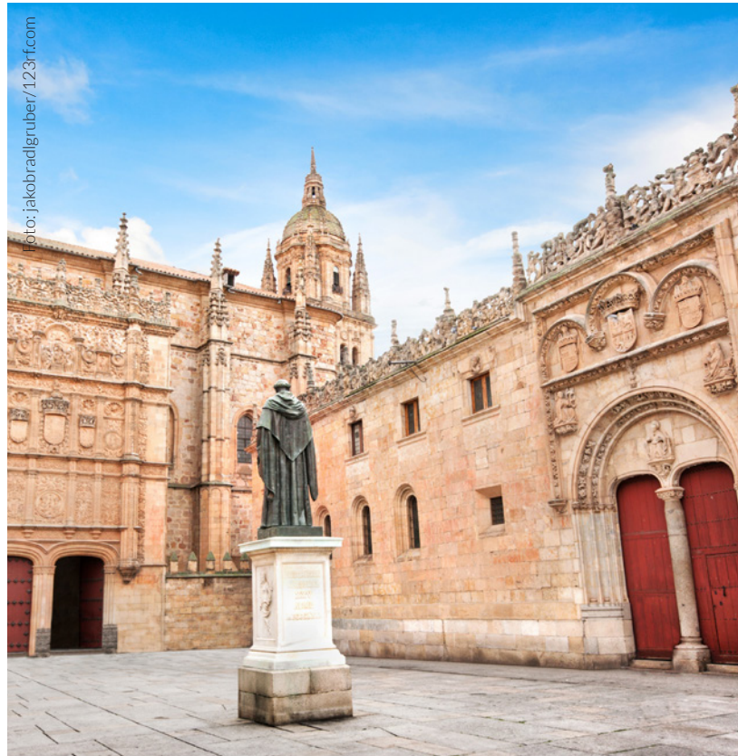
▲ UNIVERSIDADE DE SALAMANCA

A Universidade de Salamanca , a mais antiga de Espanha, é a que conta com maior tradição e prestígio no ensino do espanhol.