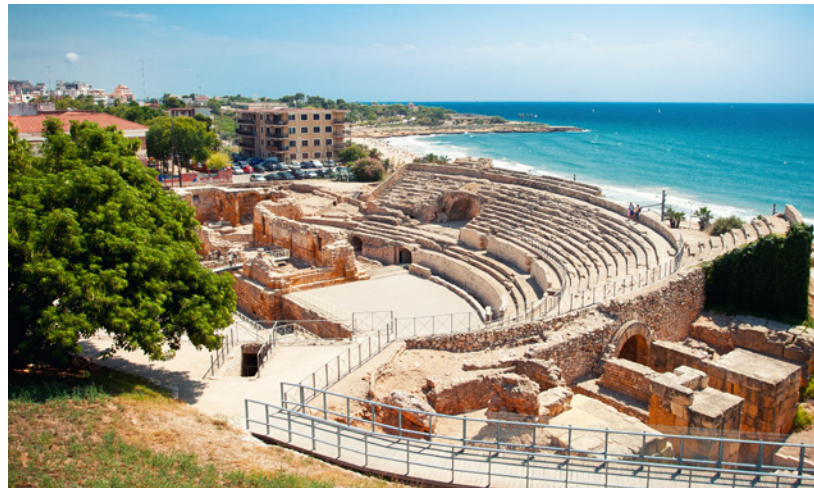
▲ ANFITEATRO ROMANO TARRAGONA

A presença romana na península durou mais de seis séculos, pelo que é muito fácil encontrar vestígios do seu legado em quase todo o território espanhol. São especialmente relevantes os vestígios arqueológicos de Tarragona e Sagunto (Valência), que conservam joias do seu passado romano como os fóruns, os anfiteatros e os teatros. Segóvia é a casa de um verdadeiro prodígio da engenharia, o aqueduto romano, um dos mais bem conservados da Europa.