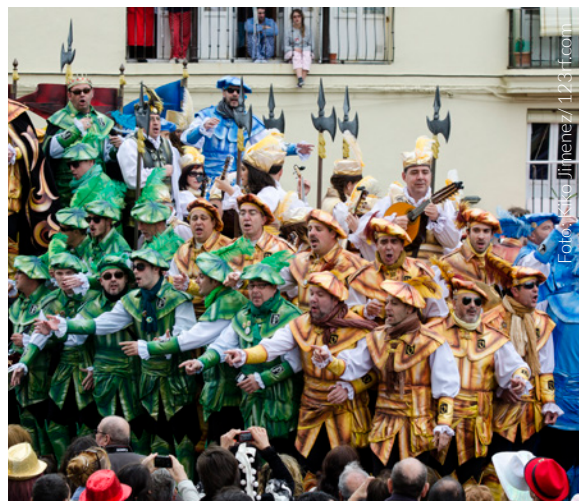
▲ CARNAVAL DE CÁDIS

Durante as Fallas, Valência transforma-se numa cidade entregue à festa e à música. Durante uma semana, a cidade enche-se de "ninots" (gigantescas esculturas que utilizam o humor como crítica social), que irão acabar convertidos em grandes fogueiras.