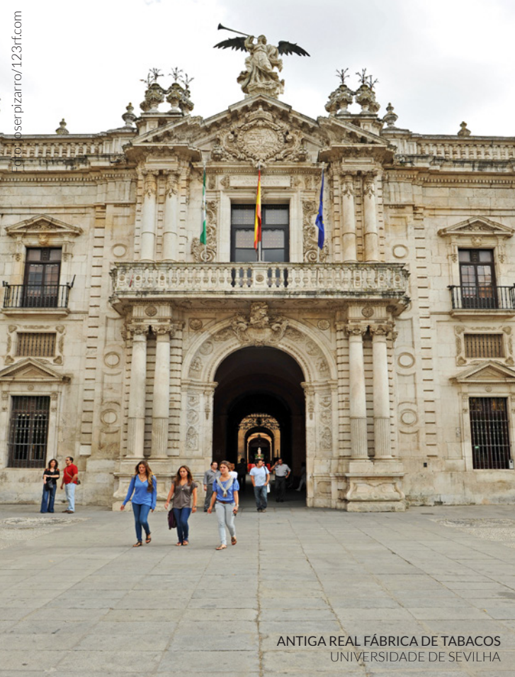
ANTIGA REAL FÁBRICA DE TABACOS UNIVERSIDADE DE SEVILHA