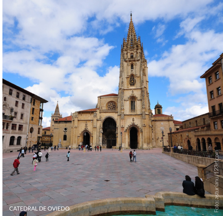
CATEDRAL DE OVIEDO

Viaja ao passado percorrendo paisagens tranquilas, degustando delícias gastronómicas, conhecendo as festas populares e os costumes das localidades por onde passam. Atreve-te a fazer alguns troços a cavalo, de bicicleta ou a pé.