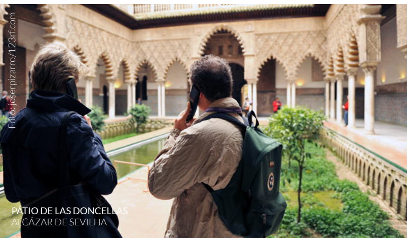
PÁTIO DE LAS DONCELLAS ALCAZAR DE SEVILHA