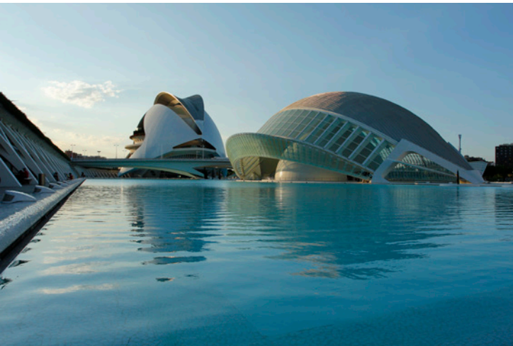
▲ CIDADE DAS ARTES E DAS CIÊNCIAS VALÊNCIA

Valência , cheia de contrastes, é a essência do Mediterrâneo. Percorre o seu centro histórico e deixa-te surpreender pelos seus edifícios vanguardistas. Deixa-te impressionar pela Cidade das Artes e das Ciências , um dos maiores complexos de divulgação científica e cultural da Europa.