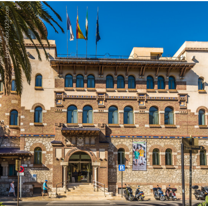
▲ UNIVERSIDADE DE MÁLAGA