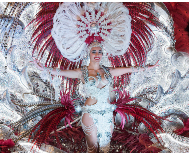
▲ CARNAVAL DE TENERIFE

Em Espanha, as festas populares acontecem durante todo o ano. Vive, sente e desfruta de Espanha através das suas festas.