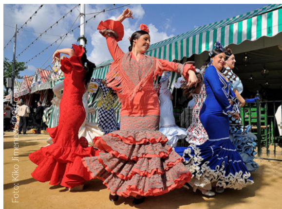
▲ FEIRA DE ABRIL SEVILHA

Sevilha durante a feira é sinónimo de diversão a todas as horas. O parque de feiras e as suas barracas enchem-se de música, gargalhadas, comida e copos de vinho fino ou "rebujito" (vinho "manzanilla" com gasosa). Não te vás embora sem provar o "pescaíto frito" e desfruta do impressionante desfile de ginetes e coches de cavalos.