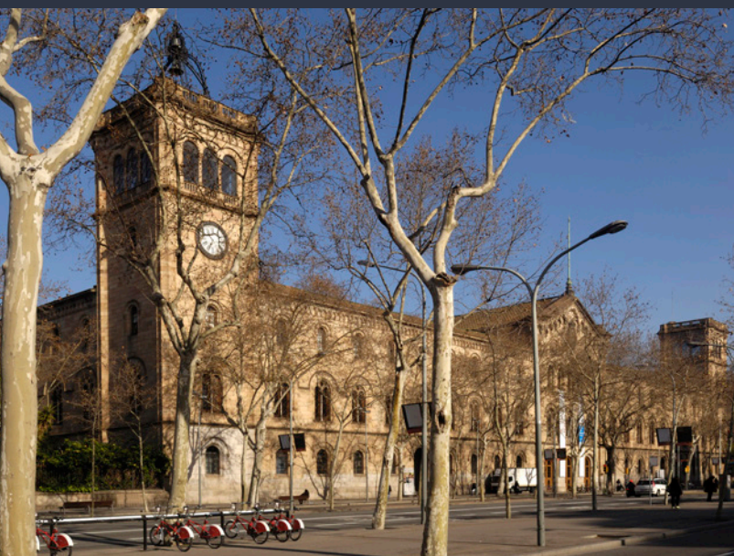
▲ UNIVERSIDADE DE BARCELONA

Cidade cosmopolita e aberta, a sua localização geográfica e a sua oferta cultural e de ócio fazem dela um destino ideal para todos aqueles que desejem desfrutar de uma estadia inesquecível. Em Barcelona encontram-se várias das universidades mais importantes de Espanha, como a Pompeu Fabra, a Universidade de Barcelona e a Autónoma de Barcelona.