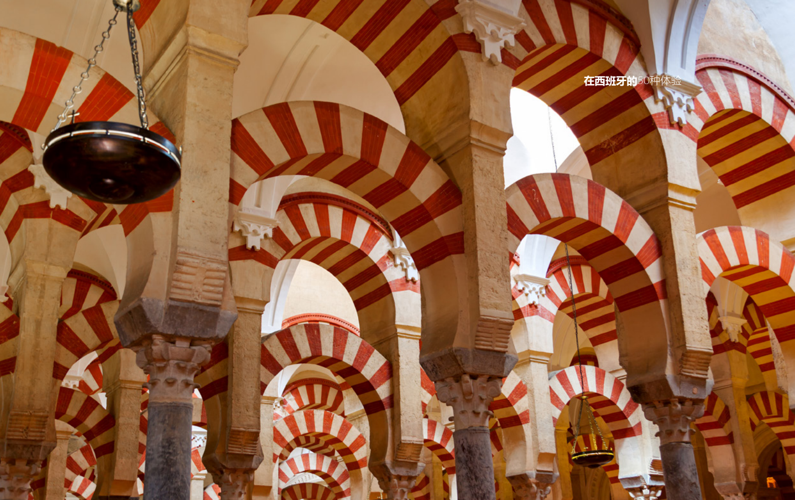
▲ 科尔多瓦清真寺-大教堂 (Mezquita-Catedral de Córdoba)