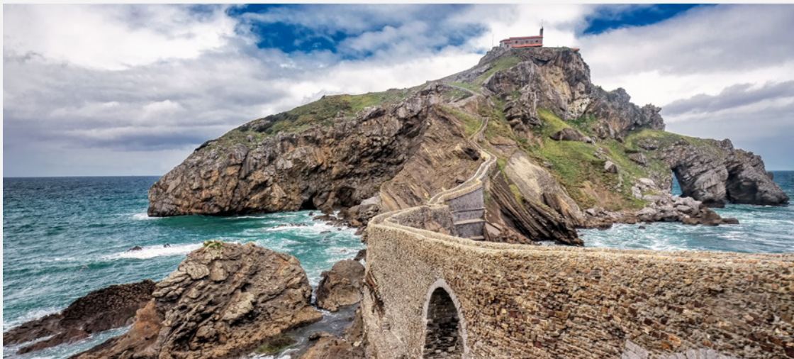
▲ 圣胡安德加兹特鲁卡切 贝尔梅奥（巴斯克地区）

想要探访《权力的游戏》的拍摄地或是詹姆斯·邦德、印第安纳·琼斯或阿纳金·天行者电影中冒险场景的拍摄地吗？西班牙作为一个电影盛地，在许多城市都可以找到与电影有关的路线。选择你最喜欢的吧。