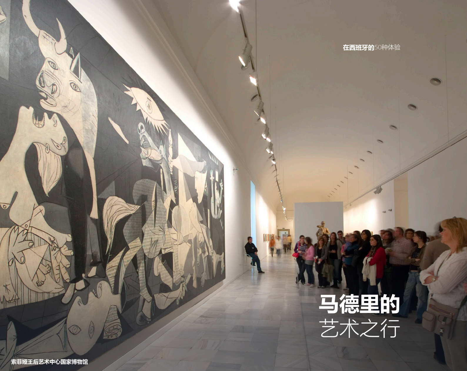
索菲娅王后艺术中心国家博物馆