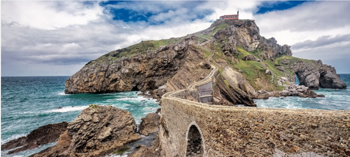
▲ SAN JUAN DE GAZTELUGATXE BERMEO, PAYS BASQUE

Vous voulez visiter les décors de Game of Thrones ou les endroits où James Bond, Indiana Jones et Anakin Skywalker ont tourné leurs fameuses aventures ? L'Espagne est une destination cinématographique par excellence et de nombreuses villes proposent des itinéraires autour du septième art. Choisissez le vôtre.