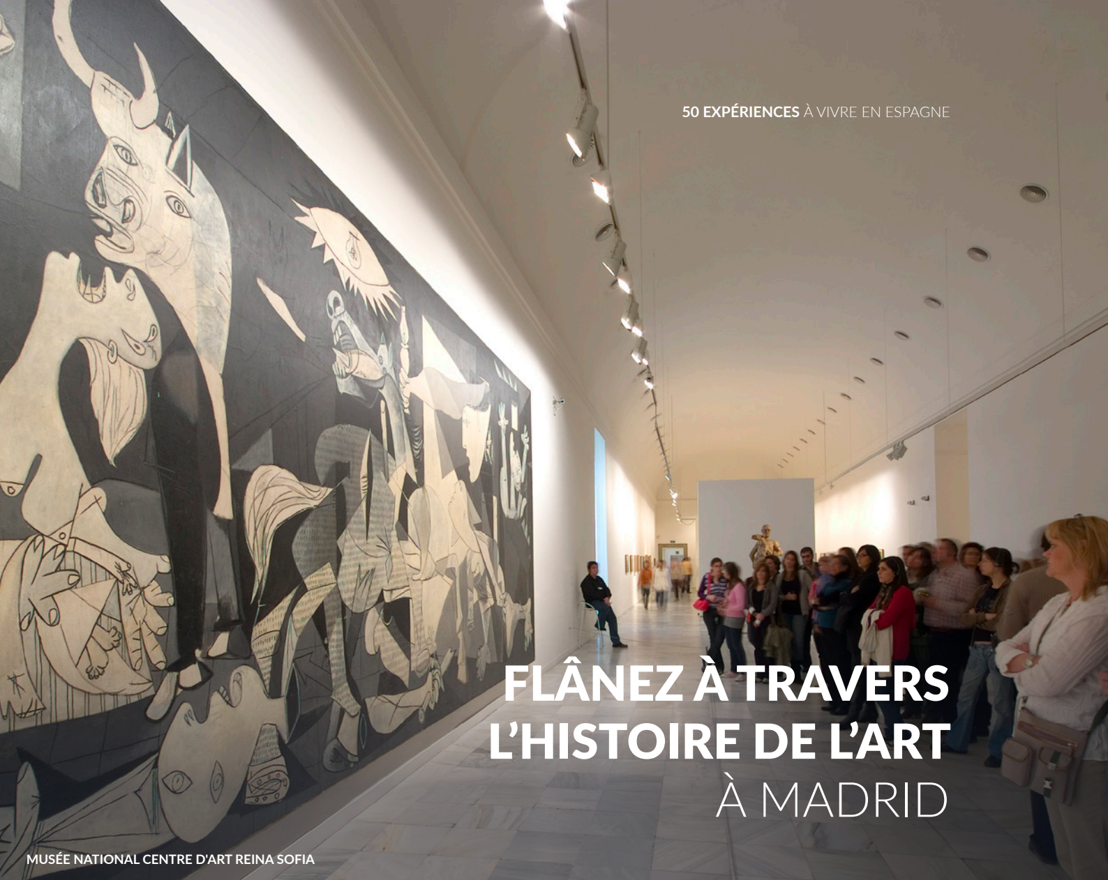
MUSÉE NATIONAL CENTRE D'ART REINA SOFIA