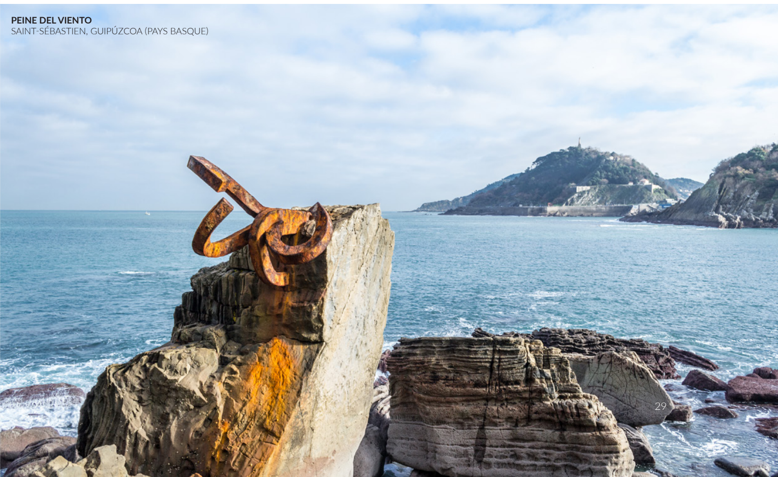
PEINE DEL VIENTO SAINT-SÉBASTIEN, GUIPÚZCOA (PAYS BASQUE)