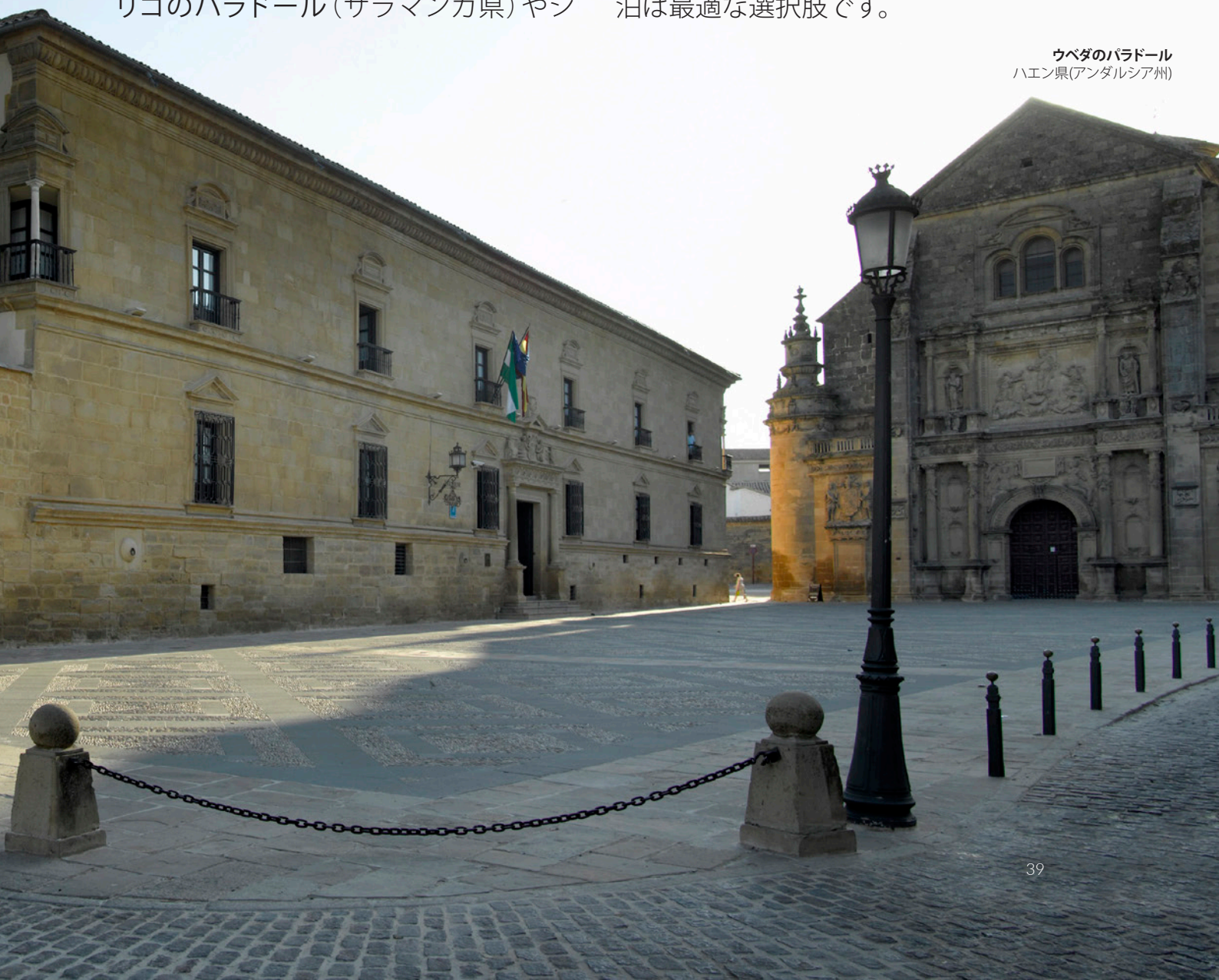
ウベダのパラドール ハエン県(アンダルシア州)

現在、スペインには90を超えるパラドールがあるので、選択肢はたくさんあります。大自然の中、素晴らしい展望ポイント、歴史地区の中心など、そのほとんどが非常に恵まれた場所に立地しています。パラドール自体が歴史モニュメントであるものも多数あります。歴史を間近に感じてみたいなら、パラドールでの宿泊は最適な選択肢です。