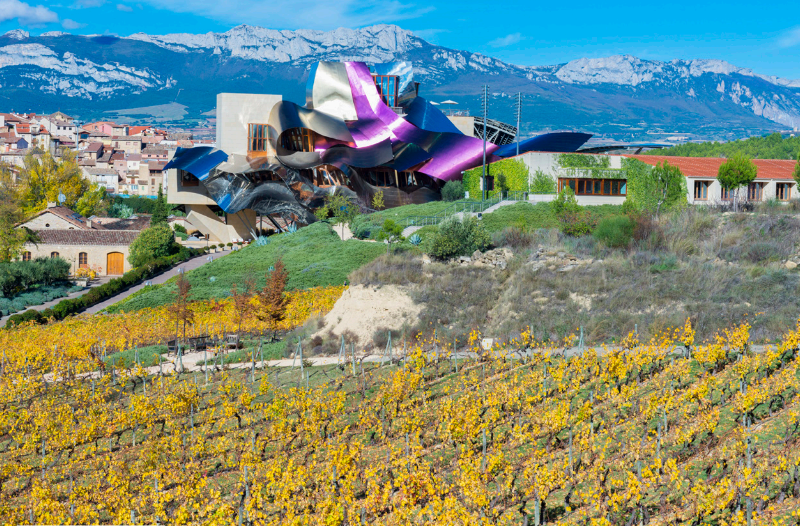
▲ 「ラ・シウダ・デル・ビノ」 エルシエゴ