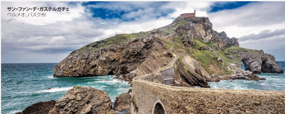
サン・ファン・デ・ガステルガチェ ベルメオ、バスク州

「ゲーム・オブ・スローンズ」の舞台となった場所、あるいは、ジェームス・ボンド、インディアナ・ジョーンズやアナキン・スカイウォーカーがロケをした場所を訪ねてみませんか？スペインはよく映画の舞台に選ばれる国なので、多くの街で映画に関連する観光スポットがあります。あなたの旅の舞台はどこでしょう。