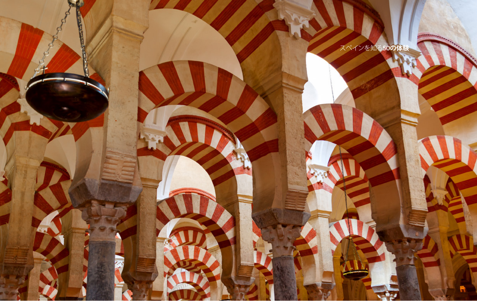
▲ コルドバのメスキータ