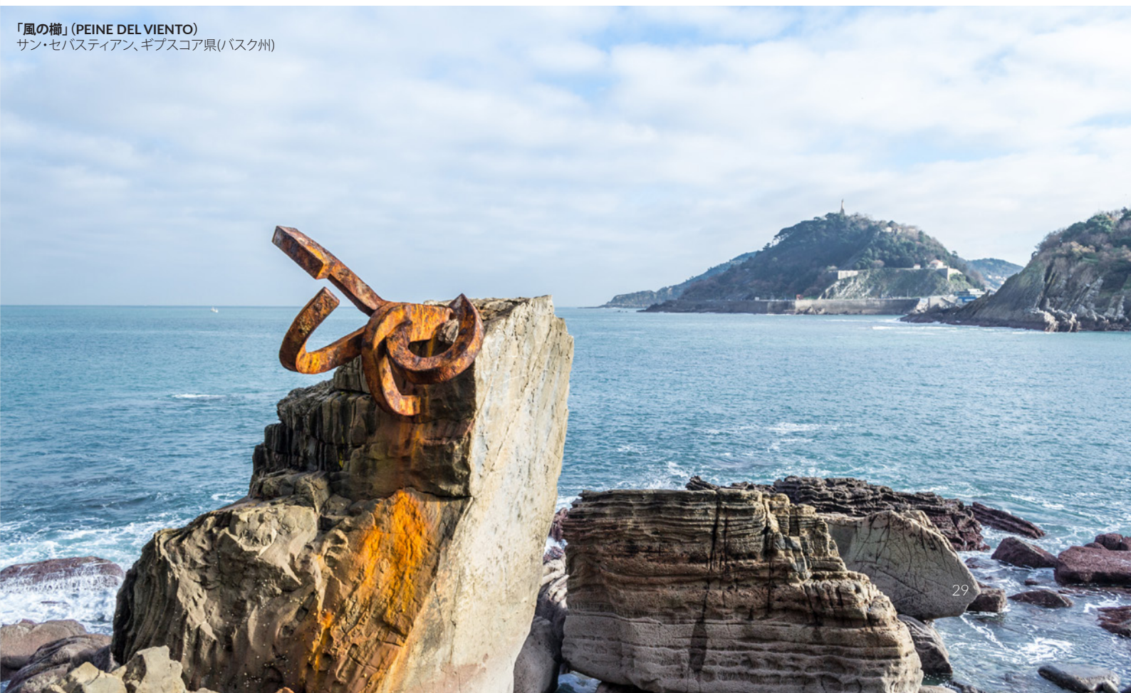
「風の櫛」(PEINE DEL VIENTO) サン・セバスティアン、ギブスコア県(バスク州)