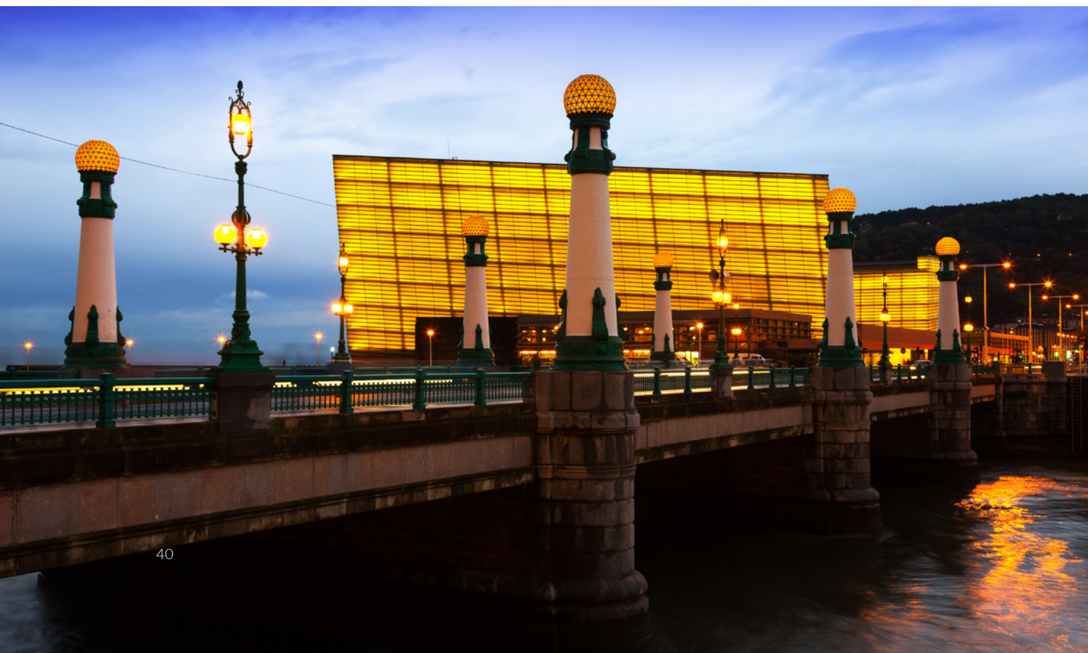
▼ クルサール国際会議場 サン・セバスティアン、ギプスコア県(バスク州)

その他にスペインのプリッカー賞建築家としては、2017年に受賞した、建築スタジオ「RCRアーキテクテス」(ジローナ県)に所属するラファエル・アランダ、カルメ・ピジェンとラモン・ビラルタが挙げられます。彼らの作品のほとんどはカタルーニャにあります。バルセロナのアシャンプラ地区にあるサン・アントニ＝ジョアン・オリベール図書館やオロット(ジローナ県)にある陸上競技場とパビリオン2x1、あるいはレス・プレセス(ジローナ県)のピエドラ・トスカ公園などは、見逃せない作品です。